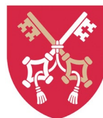
Pontificia Università Giovanni Paolo II di Cracovia