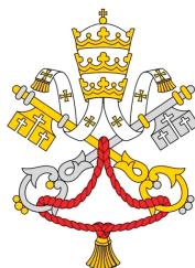
Dicastero per la Cultura e l'Educazione